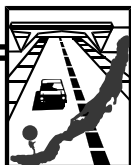
Схема территориального планирования муниципального образования Алтайский район

Положения о территориальном планировании