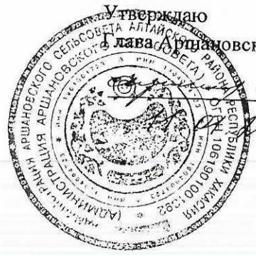
СХЕМА ТЕПЛОВАЯ СЕТЬ с. АРШАНОВО